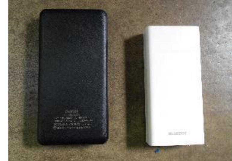
モバイルバッテリー