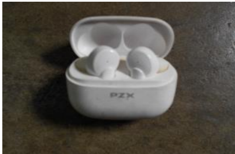
ワイヤレスイヤホン