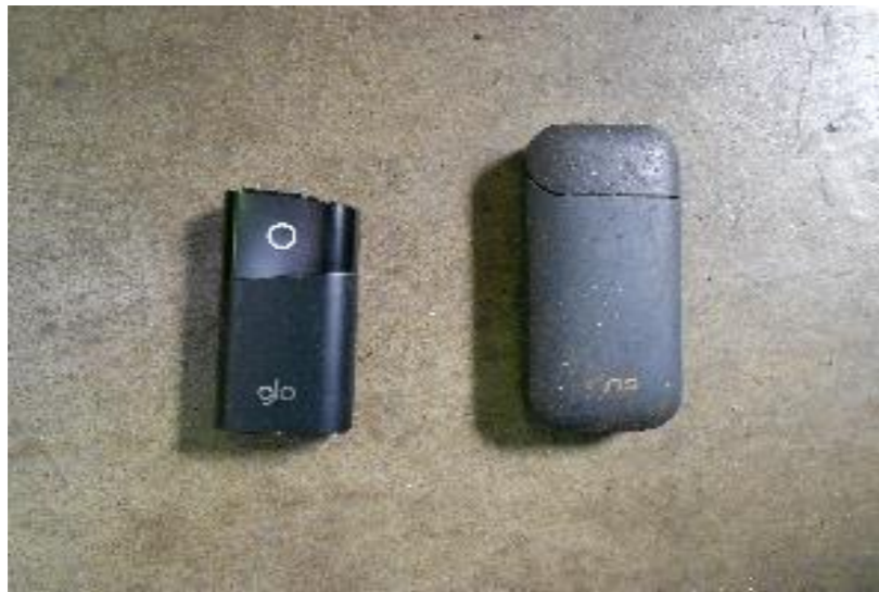
電子（加熱式）タバコ