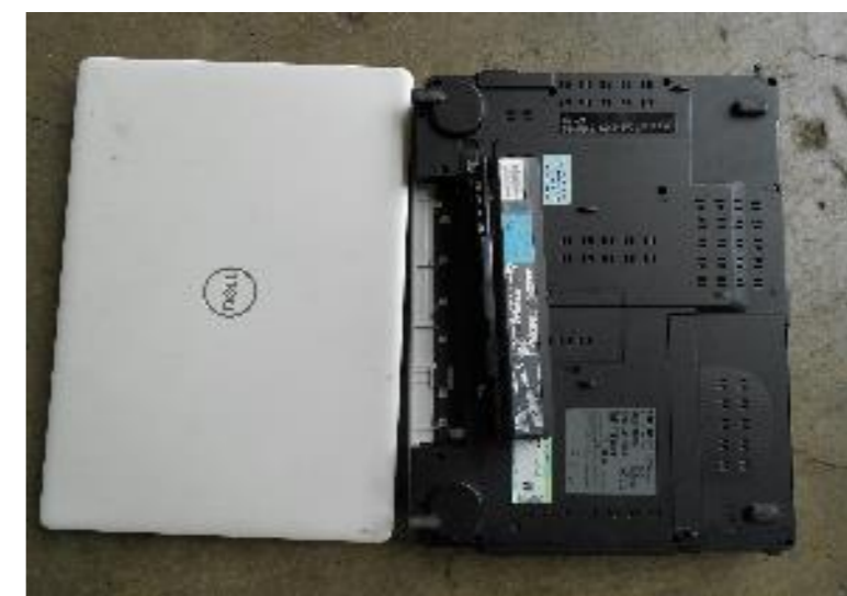
ノートパソコン・タブレット