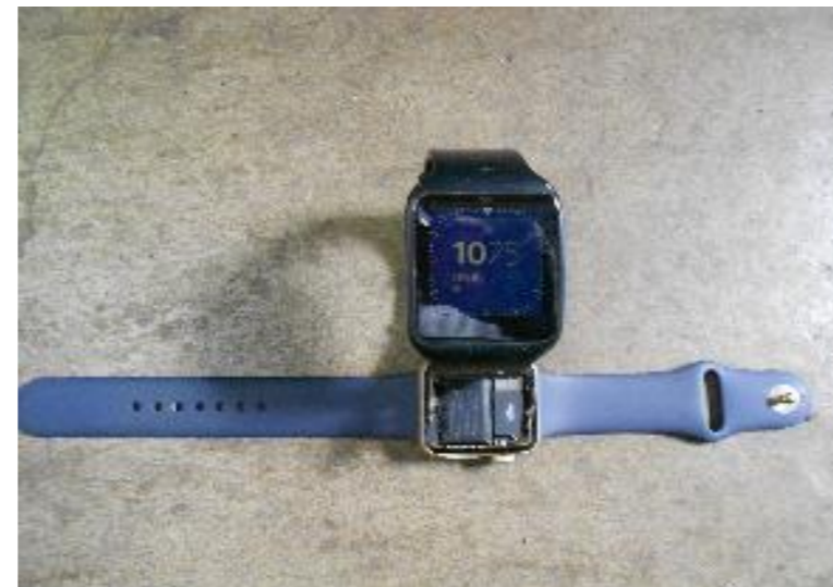
スマートウォッチ