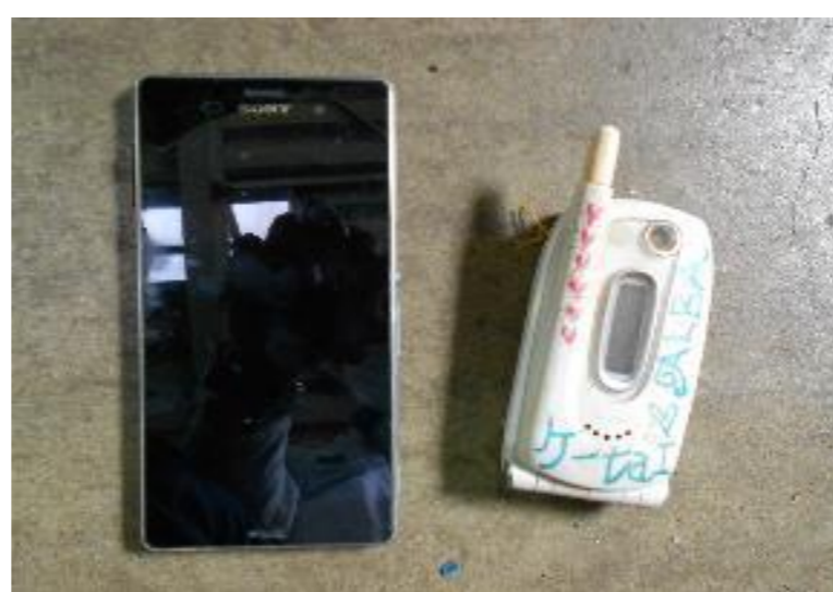
スマートホン、携帯電話